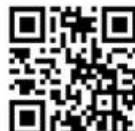
アドベンチャー集団Do! Facebook